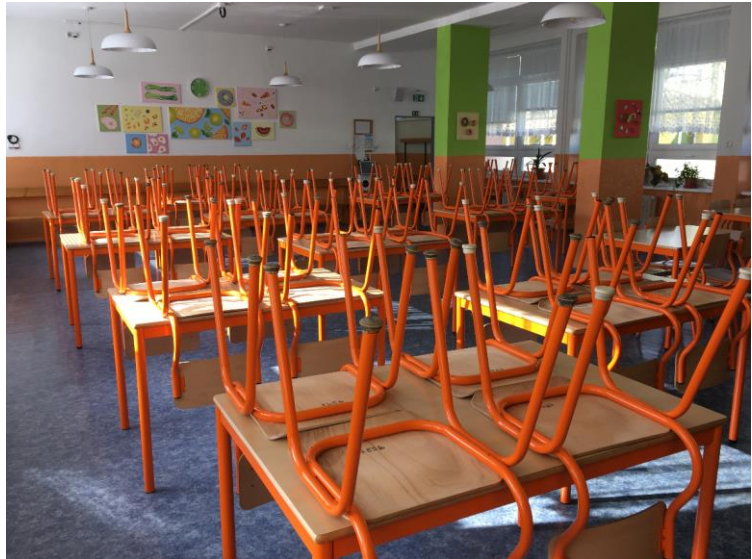
Čítárna v 1. podlaží